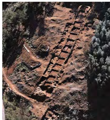
直方文化財調査報告書 第五集より