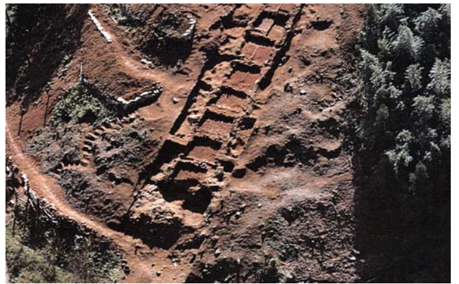
内ヶ磯窯跡

パールと呼ばれる植物の微細なガラス質の物質を抽出することにより、その土地でどんな作物が栽培されていたか推定できるようになってきたが、一旦掘り返された遺跡では、そのような分析は不可能である。ユネスコが一九五六年に総会で採択した『考古学上の発掘に適用される国際的原則に関する勧告』では、加盟国に対し「発掘が考古学的技術及び知識の進歩を享受し得るため、各時代の考古学的遺跡の相当数を全部または一部、手を触れずに維持することの考慮」