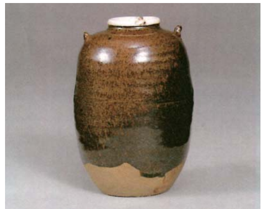
写真② 高取耳付茶入(遠州好み) 福岡市美術館所蔵

この一文の裏を返せば、利休・ 織部・遠州の好みの姿の茶入が存 在することが伺えます。内ヶ磯窯 は、時代的にも織部と遠州の影響 を受けていた時代の窯であること は間違いありません。