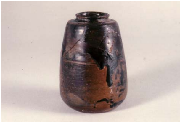
肩付尻膨茶入 口径 3.0cm 器高 8.5cm 底径 4.0cm

筒形の肩付茶入である。ほぼ完形に近いもので、出土地区は焚口の覆土から出土している。これは、上の焼成室より落下したものである。口径三、〇cm、器高八、五cm、底径四、〇cmを測る。胎