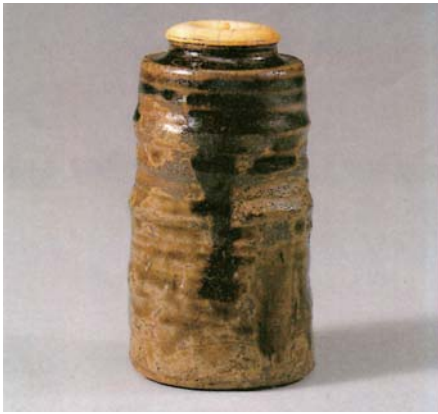
写真① 高取肩付茶入(織部好み) 福岡市美術館所蔵